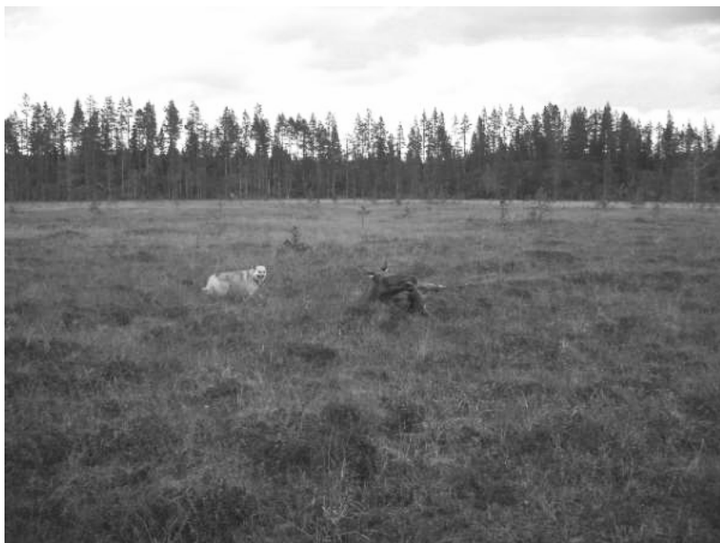
Rippe, vid sin första älg

Inavelgraden klart sjunkande, men även här slår varje parning hårt i procent. Vi skall och bör ligga under tre procent. Viktigt är därför att kontakta avelsrådet före parning för få hjälp med att utse en täckhund som ger mindre än tre procent i inavelsgrad. Ett antal parningar har skett utan avelsrådets medverkan med inavlesgrader på 6,25 % och över, sådana parningar slår hårt på rasen. Hundar med hög inavlesgrad löper större risk att drabbas av allvarliga sjukdomar.