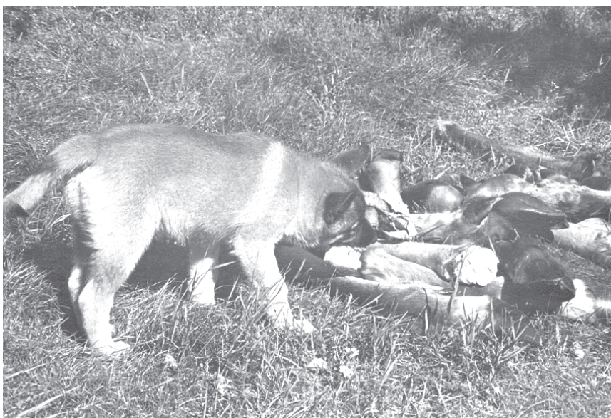
Valp vid hög med ben