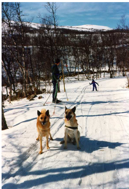
Skidåkning med hund -en utmärkt träningsform