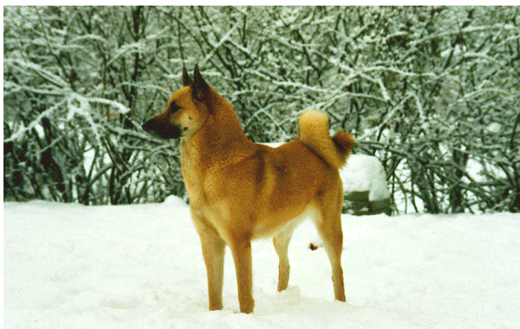
En spejande Hälleforsare

Jag vill göra tikägare uppmärksam på det ansvar man ikläder sig som uppfödare, man skall följa god kynologisk sed (vilket vi beslutat i klubben att vi skall följa) vilket innebär att man skall använda friska och sunda avelsdjur utan fysiska eller psykiska defekter. Samt att man bedriver avel på sådant sätt att man ej belastar avelsdjuren i synnerhet tiken med för täta kullar, mer om detta kommer i nästa nummer av tidningen. Även frågor som juridik i konsumentlagen blir nödvändigt att känna till. Man skall hitta ett bra hem åt dem alla, och (för kennlar) ha ett ansvar för dem i två år även därefter, enligt konsumentköplagen.