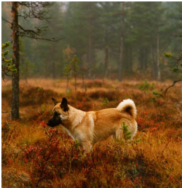
Valp på strövtåg