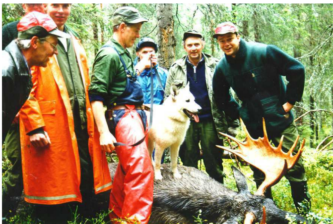
Förutom en solid klubbkassa gläds vår kassör här av en lyckad jakt.