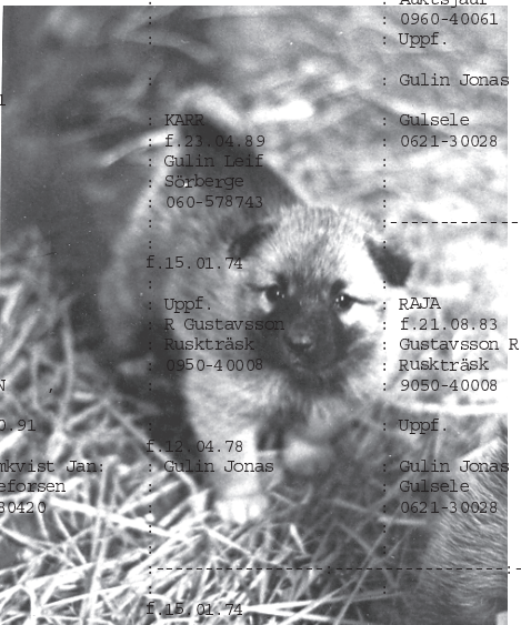
Valp på strövtåg i halmen

-A-registret är öppet för hundar, födda 1994 och senare, efter föräldrar som är godkända av avelsrådet. För godkännande av föräldradjur ställs vissa minikrav på häststamning, jaktförmåga och typ.