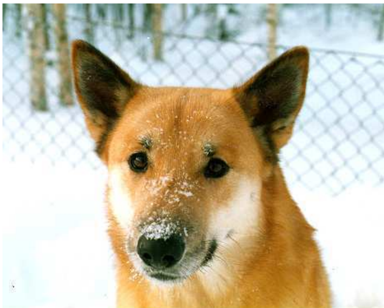
Ett välutvecklat luktorgan är hundens viktigaste sinne.