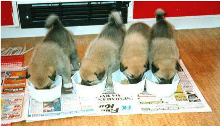
Fyra stycken friska och sunda valpar, eller.....