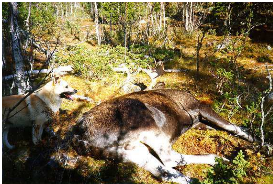
Fjällälg fälld på stånd. Börje Larssons hund Jim river raggen av en älgdjur efter avslutad jakt