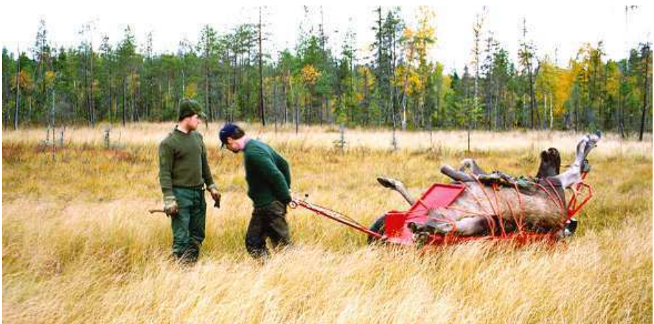
Julmaten på väg hem ur skogen