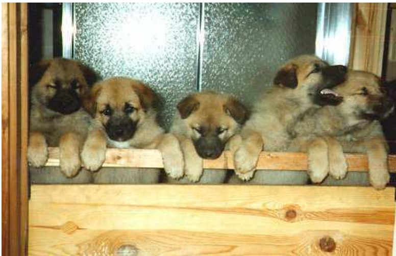
Ivriga valpar som förväntansfullt tittar ut mot en värld fylld med många älgar och snälla hundägare